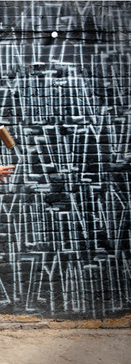
Lizzy Vuitton mural at The Star of The East Pub, Limehouse.