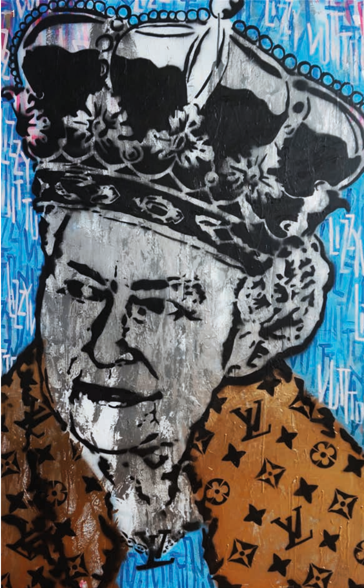
1) Lizzie Vuitton Crown Blue , 2019 Acrylic, oil paint and spray paint on canvas 150 x 100 cm, 59 x 39.4 in