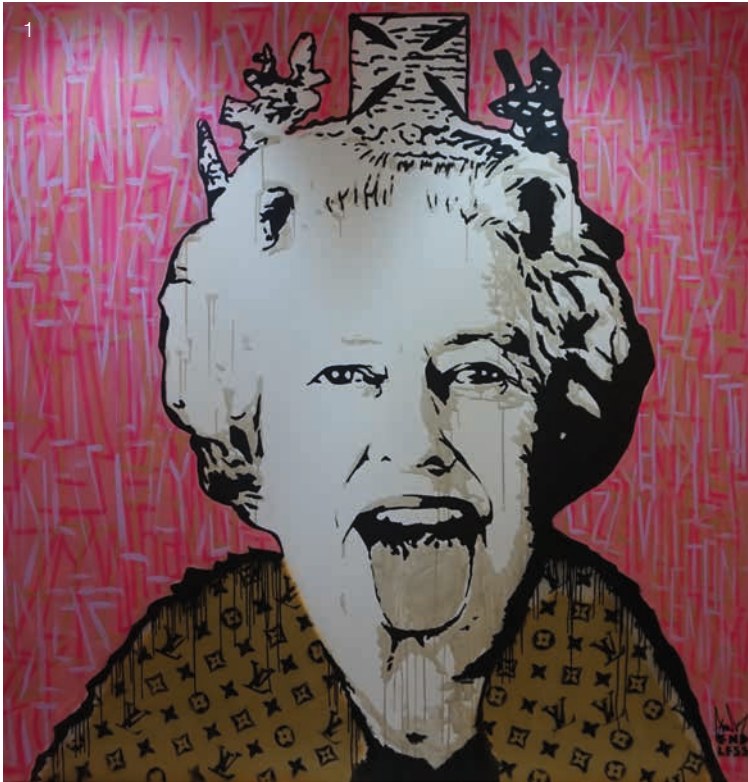
1) Lizzie Vuitton Pink Punk Cortina , 2018 Acrylic and spray paint on wood 200 x 200 cm, 78.74 x 78.74 in