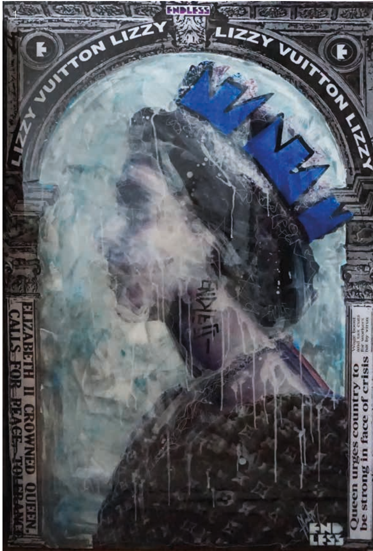
1) Lizzy Vuitton Blue Crown , 2020 Mixed media on canvas with a resin finish 150 x 100 cm, 59 x 39.4 in