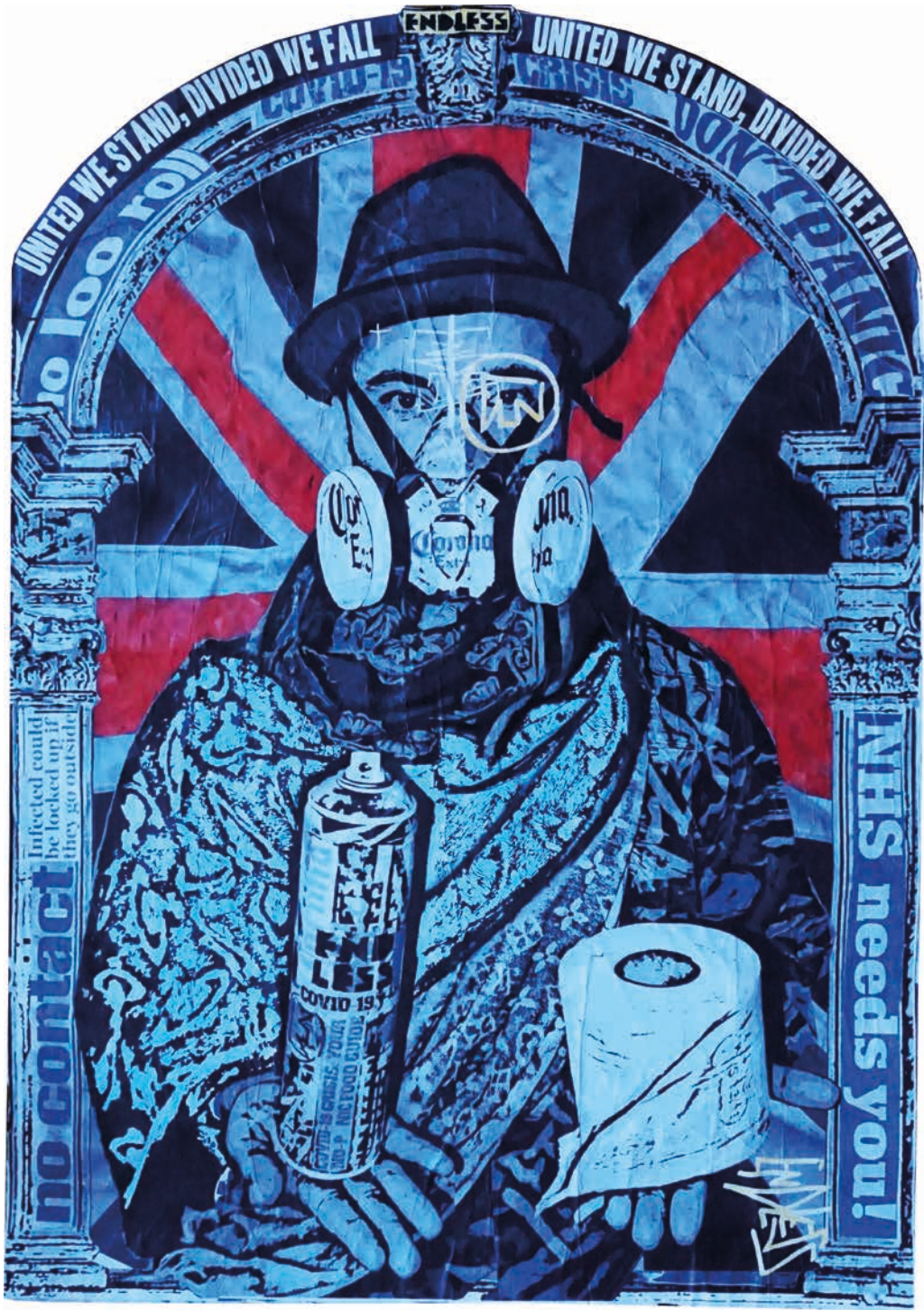
DON'T PANIC XL , 2020