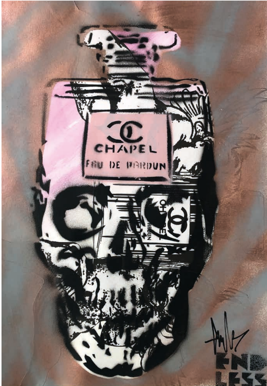
Endless sketch books - Series One (Skull V), 2019