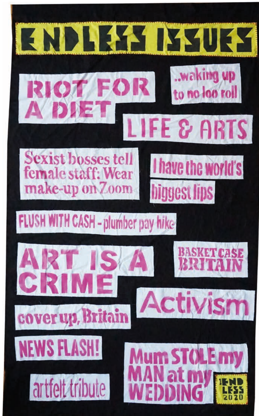
ENDLESS ISSUES 1, 2020