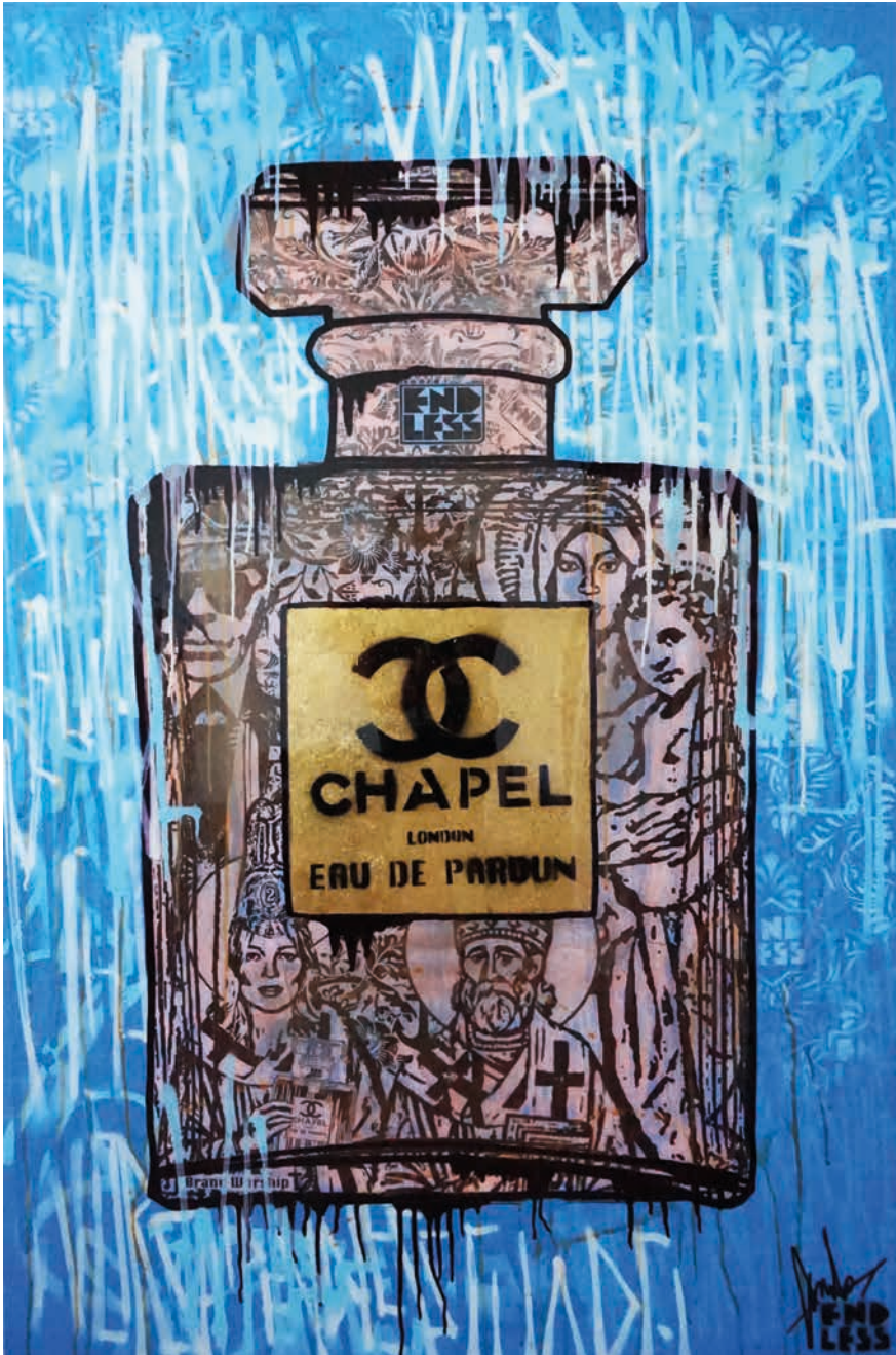
CHAPEL RELIGION BLUE, 2020 Mixed media on canvas with a resin finish 152.5 x 101.5 cm, 60 x 39.96 in