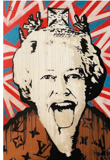
5) Cortina D'Ampezzo , 2018