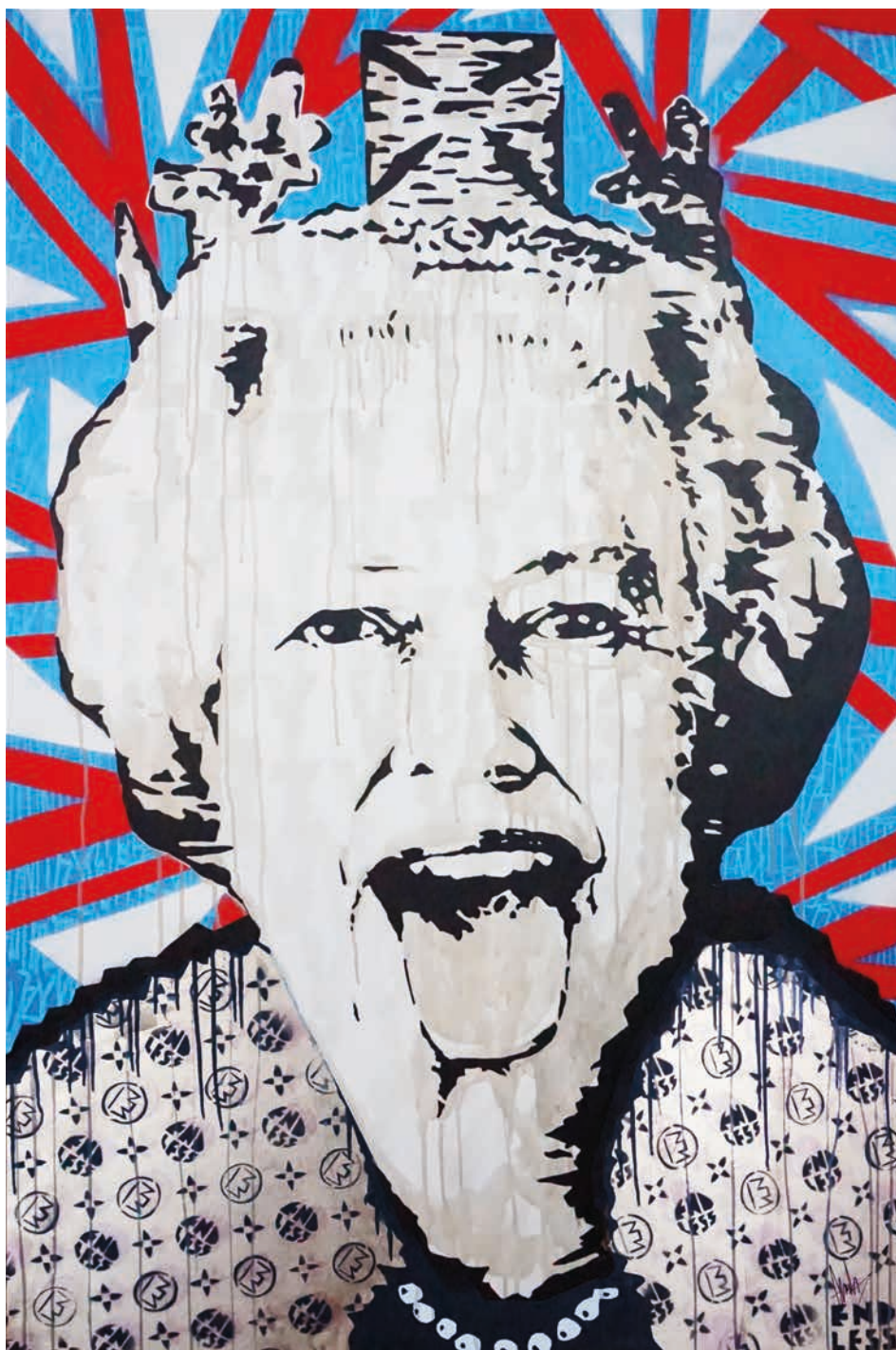
LIZZY VUITTON FT, 2020