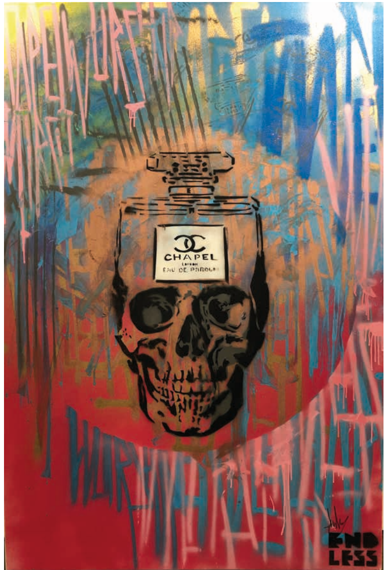
CHAPEL WORSHIP MAYFAIR II (Live Painting), 2019