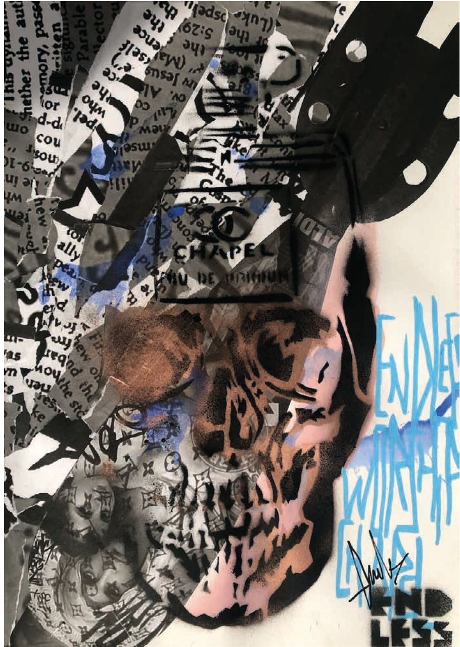
Endless sketch books - Series One (Skull XVI), 2019