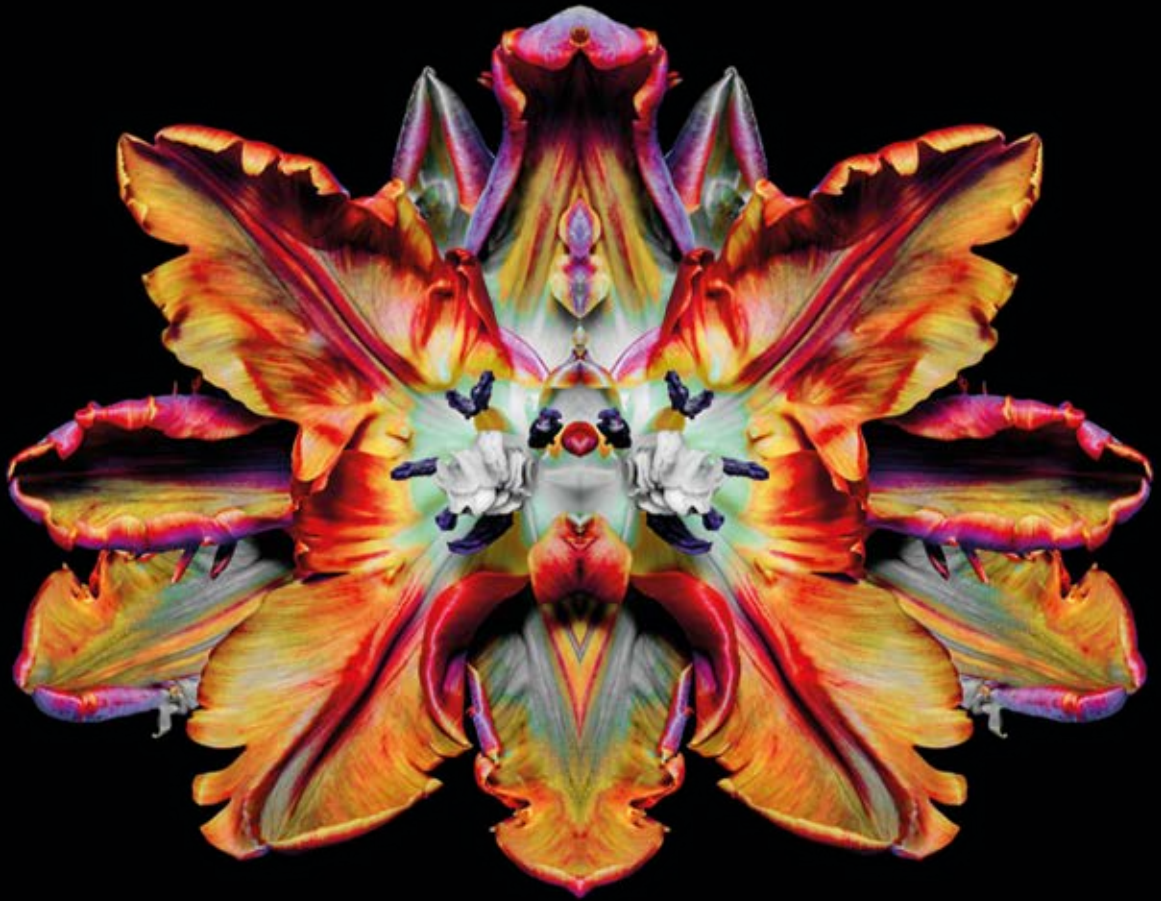
Corydon Exactoris, Rorschach Flower Series, Courtesy of Cris Contini Contemporary