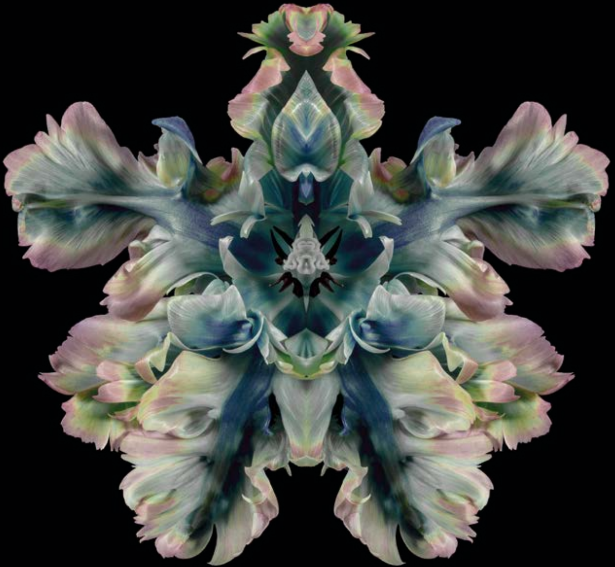
Militans Virentia, Rorschach Flower, Courtesy Cris Contini Contemporary