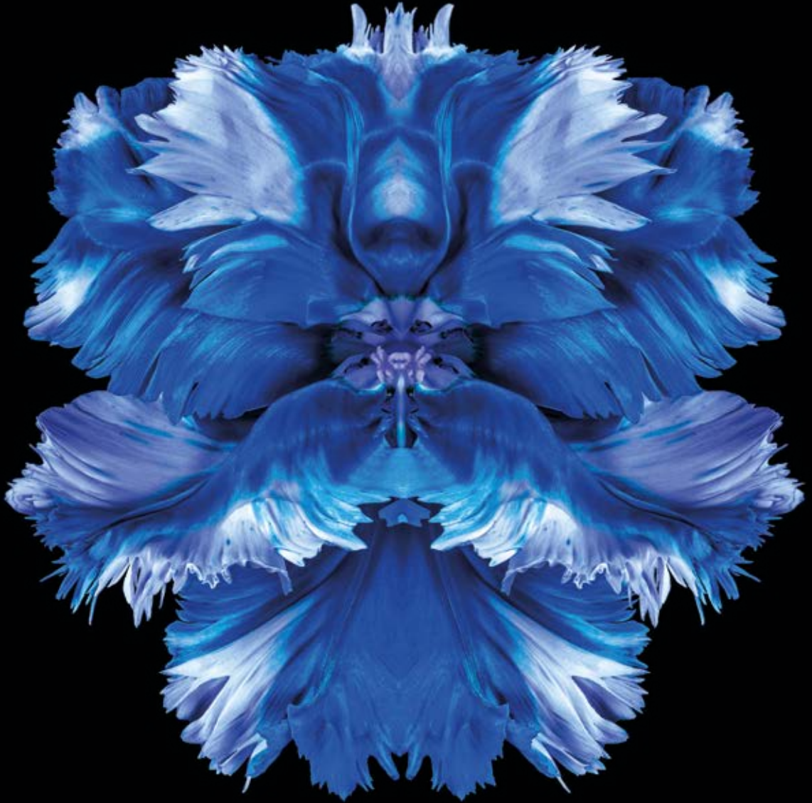
Sibilus Spiritus, Rorschach Flower Series