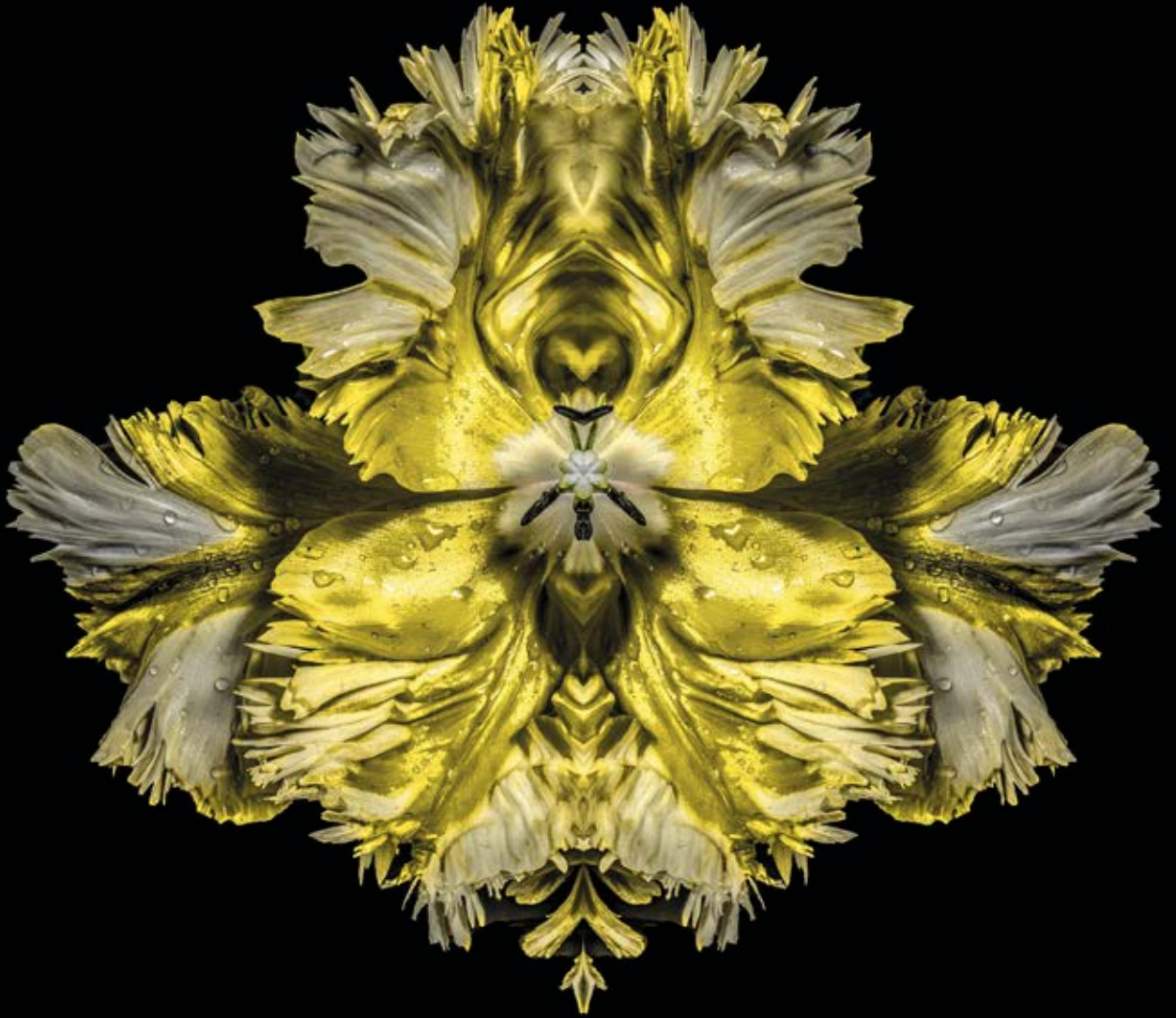
Gold Baroque, Rorschach Flower